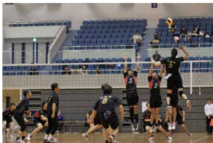
好球会 VS 吉浦クラブ