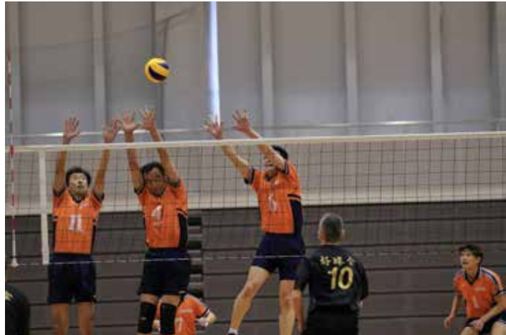
広島倶楽部 VS 好球会