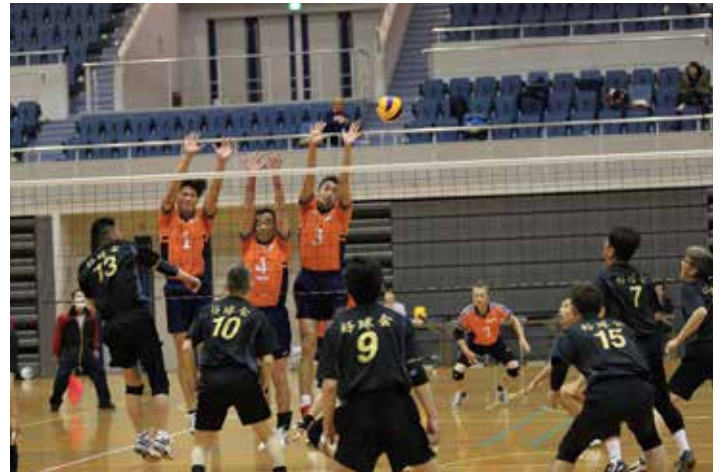
広島倶楽部 VS 好球会