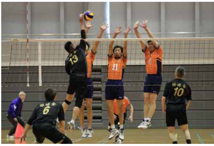
広島倶楽部 VS 好球会