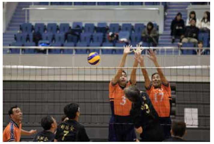
広島倶楽部 VS 好球会