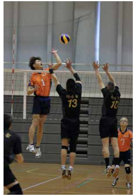
広島倶楽部 VS 好球会