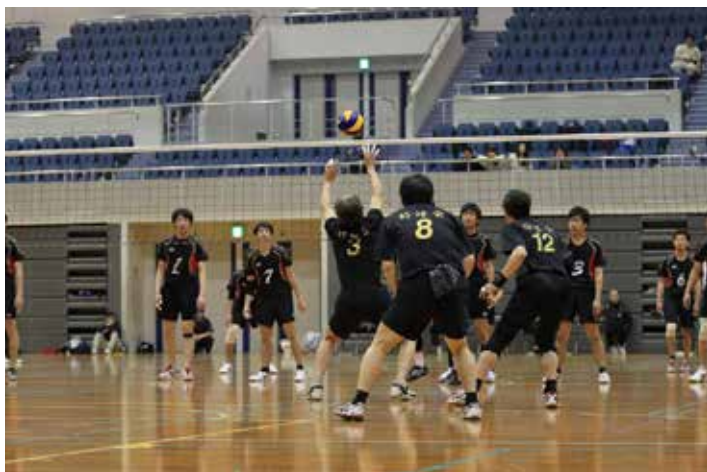
好球会 VS 吉浦クラブ