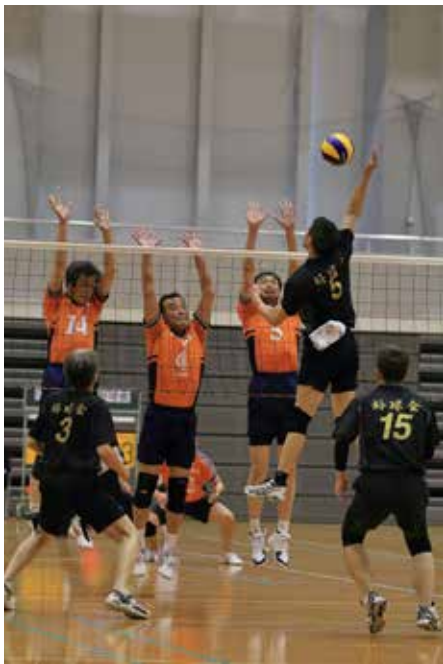
広島倶楽部 VS 好球会