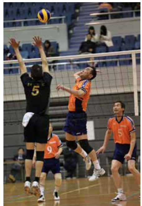
広島倶楽部 VS 好球会