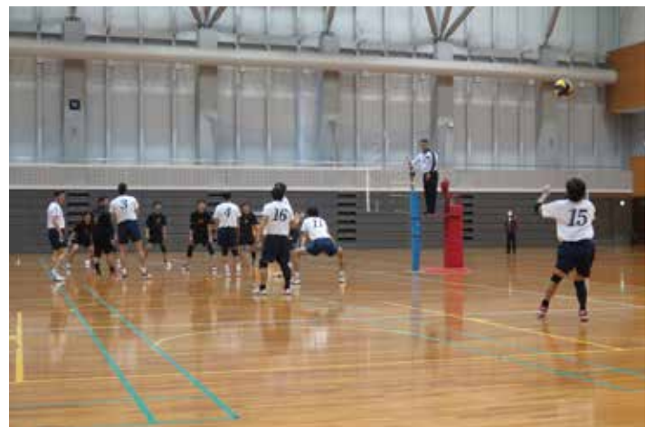
広島倶楽部 VS 三十路会