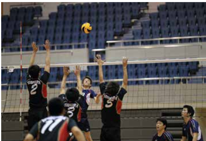
MHPS 呉 VS 吉浦クラブ