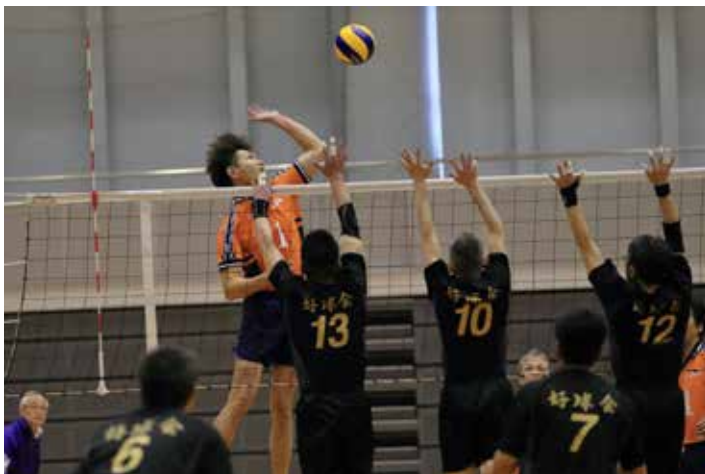
広島倶楽部 VS 好球会