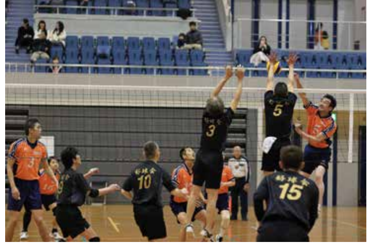
広島倶楽部 VS 好球会