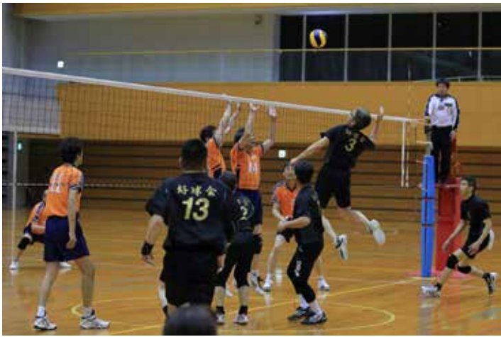
広島倶楽部 VS 好球会