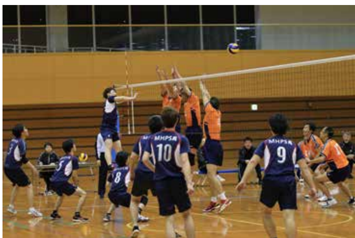
MHPS 呉 VS 広島倶楽部