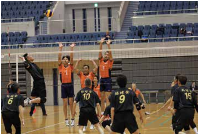
広島倶楽部 VS 好球会