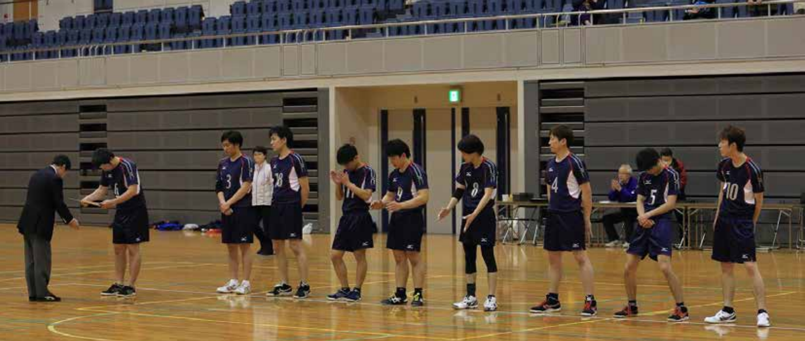
1位 MHPS 呉