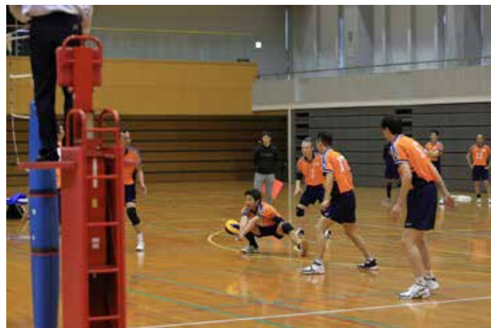
MHPS 呉 VS 広島倶楽部