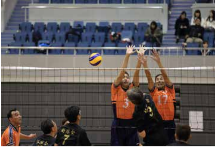
広島倶楽部 VS 好球会