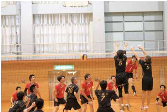
八景山 vs 好球会 2