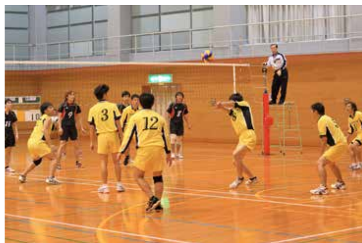
吉浦クラブ vs 倉橋クラブ 1