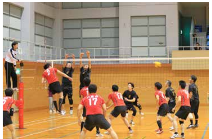
八景山 vs 好球会 3