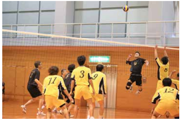
好球会 vs 倉橋クラブ 1