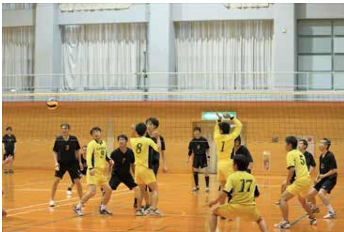
好球会 vs 倉橋クラブ 2