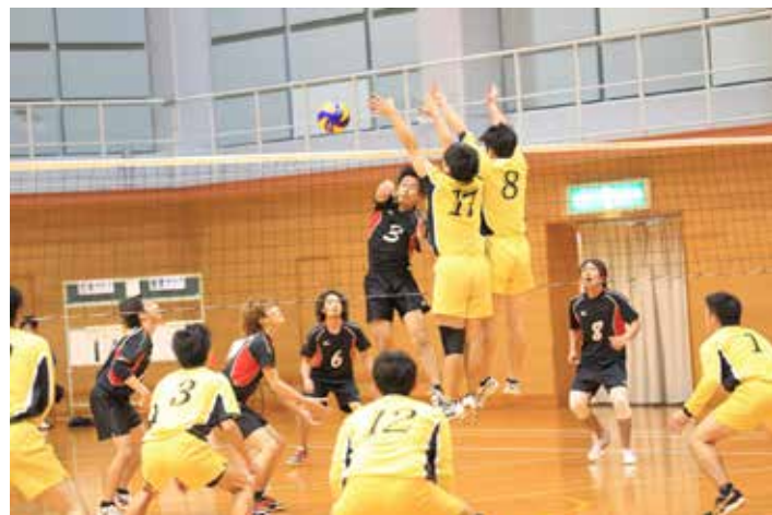
吉浦クラブ vs 倉橋クラブ 2