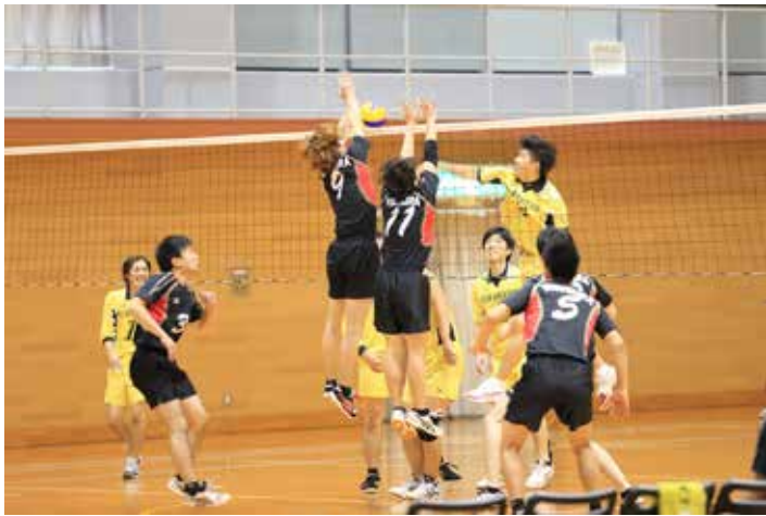
吉浦クラブ vs 倉橋クラブ 3