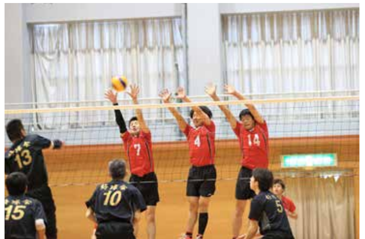
八景山 vs 好球会 1